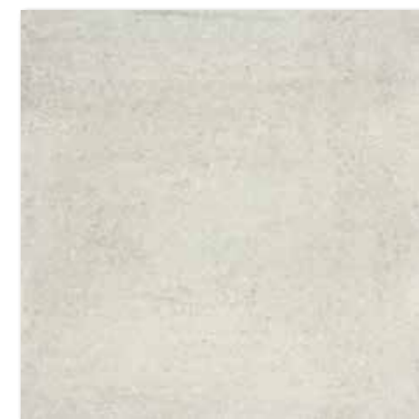
DAK63662 PEI 5 ○ 82 | m 2 mat | matt