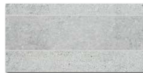
DDPSE661 PEI 5 \odot 68 | ks mat | matt