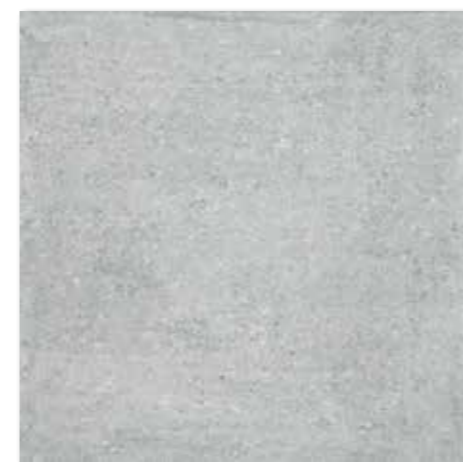
DAK63661 PEI 5 ○ 82 | m 2 mat | matt