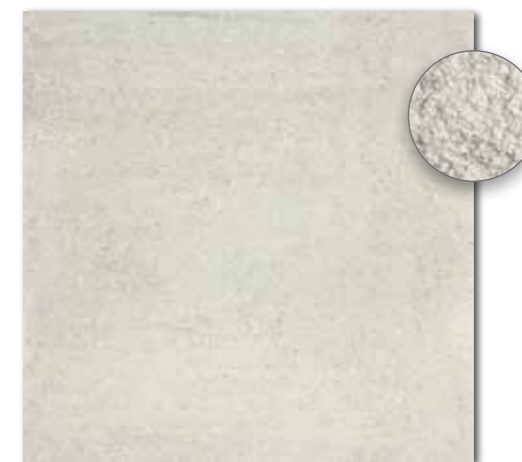
DAR63662 PEI 5 ○ 86 | m 2 mat | matt