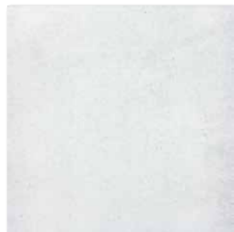
DAK63660 PEI 5 ○ 82 | m 2 mat | matt