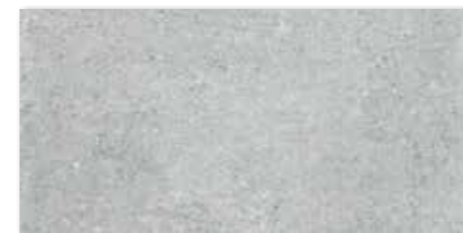
DAKSE661 PEI 5 ○ 78 | m 2 mat | matt