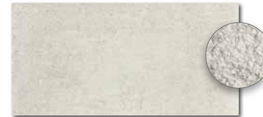
DARSE662 PEI 5 ○ 82 | m 2 mat | matt | R10 | B