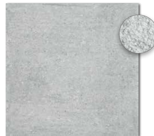
DAR63661 PEI 5 ○ 86 | m 2 mat | matt