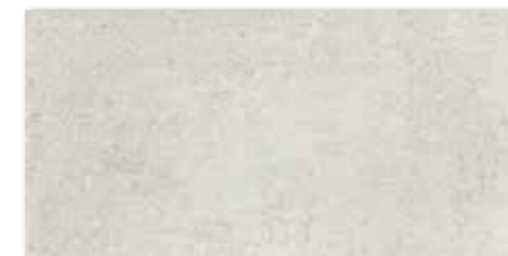
DAKSE662 PEI 5 ○ 78 | m 2 mat | matt