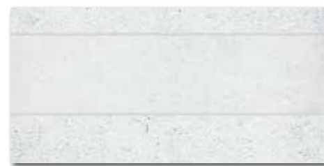
DDPSE660 PEI 5 \odot 68 | ks mat | matt