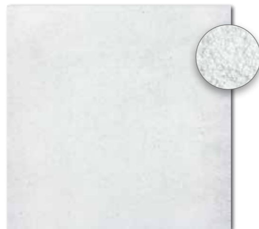
DAR63660 PEI 5 ○ 86 | m 2 mat | matt