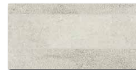
DDPSE662 PEI 5 \odot 68 | ks mat | matt